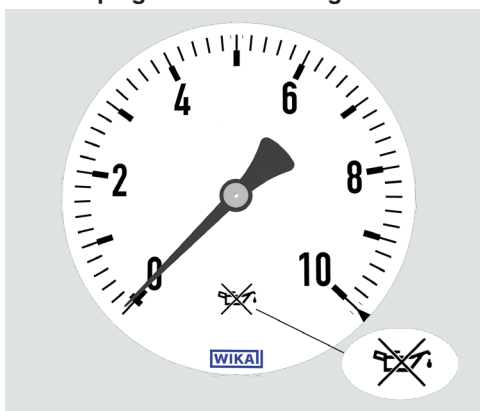
Marquage “Sans huile ni graisse”