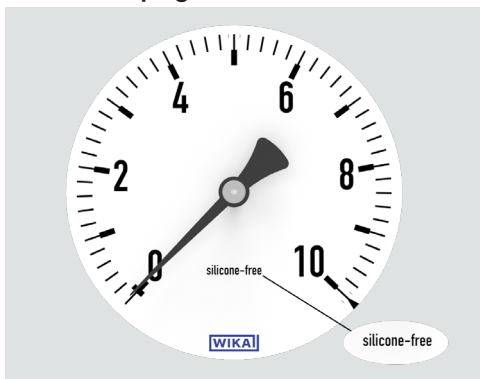
Marquage “sans silicone”